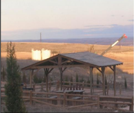
LEVANTAMIENTO DE DEPÓSITOS DE LA PLANTA TRAS EL DESCANSADERO DE LA RUTA (23-11-07)