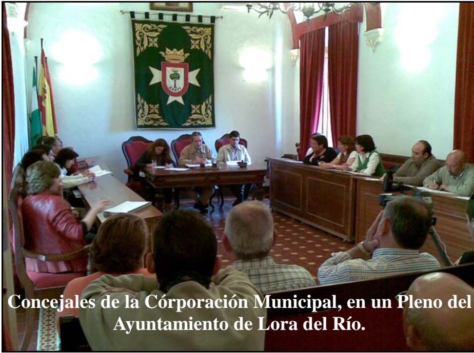
Concejales de la Corporación Municipal, en un Pleno del Ayuntamiento de Lora del Río.