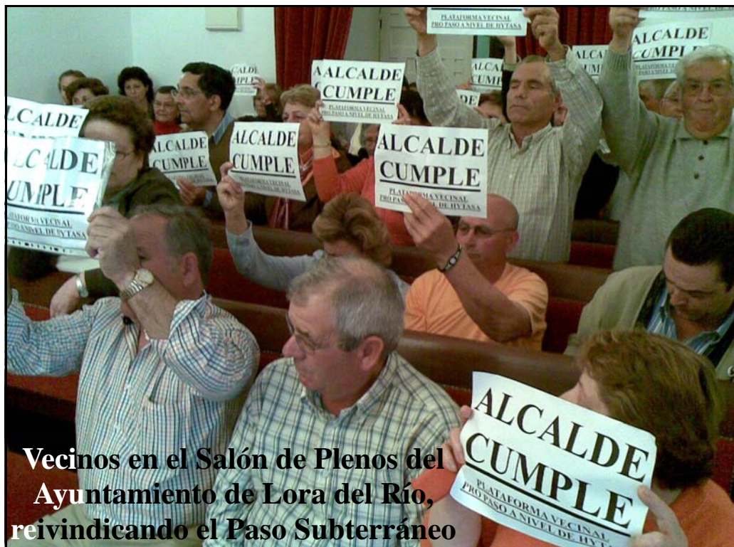
Vecinos en el Salón de Plenos del Ayuntamiento de Lora del Río, reivindicando el Paso Subterráneo

El escrito participando su adhesión a tan loable iniciativa, debe enviarlo a la Alcaldía de Lora del Río, tanto por correo electrónico, al e-mail: franjaresa@yahoo.es o haciendo entrega del mismo en el Registro General del Ayuntamiento de Lora del Río. Agradeceríamos desde esta Plataforma Vecinal, nos hicieran llegar una copia de la referida comunicación, bien a nuestro correo electrónico: propasoanivelhytasa@gmail.com ó a la dirección postal de esta Plataforma Vecinal, sita en C/ Rosa, nº 1, 41440 Lora del Río –Sevilla-.