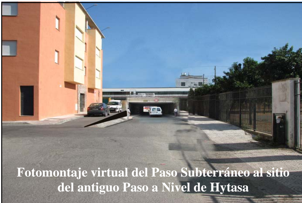
Fotomontaje virtual del Paso Subterráneo al sitio del antiguo Paso a Nivel de Hytasa

Con la construcción del paso subterráneo se recuperaría un antiguo acceso ampliamente utilizado por la población loreña para acceder al cementerio de la localidad y los barrios ubicados al Norte de la población, al igual que cuando éste funcionaba con barreras automáticas