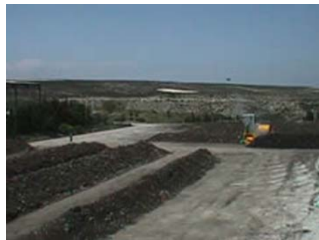
Planta de compostaje de la Mancomunidad de Montejurra (Navarra)

En la Mancomunidad de Montejurra (Navarra), la planta de compostaje y reciclaje de Cárcar ha conseguido disminuir en un 50% los residuos que se destinan al vertedero y ha servido de referencia a multitud de administraciones interesadas en