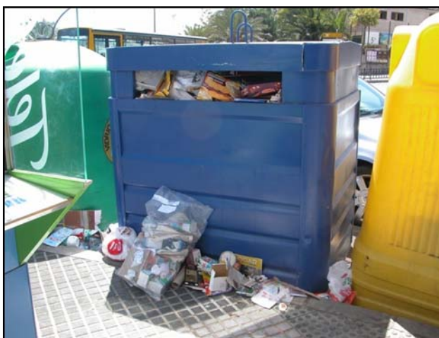
Según algunos ciudadanos, esta imagen es habitual

De los resultados obtenidos se deduce que el 27% no recicla la basura, mientras que el 73% afirma que sí separa al menos una fracción. Entre los motivos que exponen para no separar todas las fracciones destaca el hecho de que no haya contenedores próximos a las viviendas (un 69% de los encuestados), un 13% afirma que separar la basura en casa es complicado, el resto comenta que no recicla por que los contenedores están siempre llenos o porque creen que reciclar no sirve de nada.