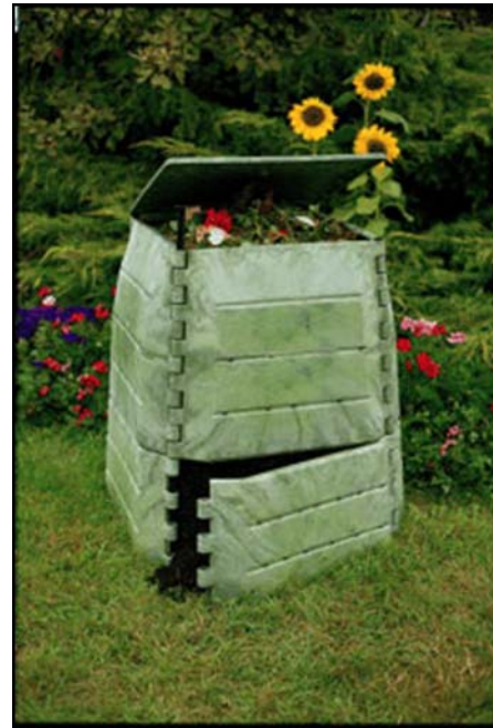
Compostador doméstico para jardines y huertos

Se debe prestar una especial atención a los puntos de mayor generación de materia orgánica: podas de parques y jardines, mercados de abastos, zonas agrícolas y ganaderas... para realizar una correcta gestión de estos recursos.