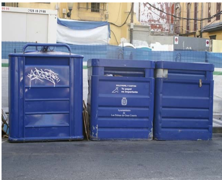
Concentración de contenedores azules en una sola zona cuando en casi todo el resto se carece de ellos

y briks ) y para el papel y el cartón sólo hay un 5% de los contenedores. Esta desigualdad en los porcentajes se traduce en la práctica en grandes dificultades de los vecinos de la zona para separar correctamente su basura.