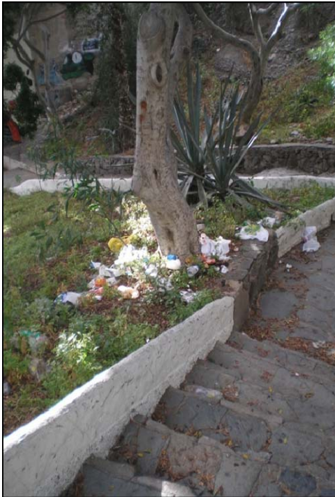
La basura en al llamado "Parque de Las Cucas" no se recoge durante semanas

ningún gestor o tirar por la alcantarilla aceites y otros productos nocivos para el medio.