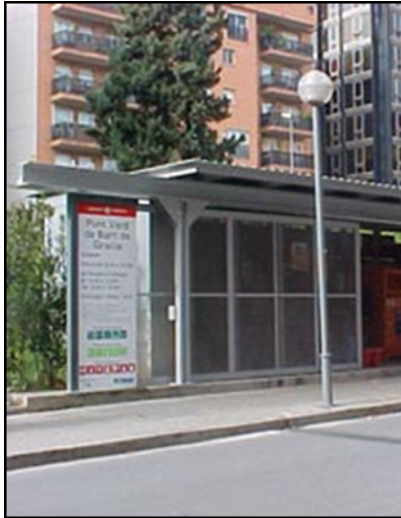
Punto limpio de barrio en la ciudad de Barcelona