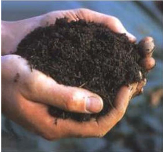
Compost o abono natural que procede de la descomposición de la materia orgánica.

Un tipo especial de reciclaje es el compostaje de materia orgánica, que imita el proceso que ocurre en la naturaleza de manera espontánea cuando los restos vegetales y excrementos animales se convierten en abono natural después de pasar por un proceso de descomposición.