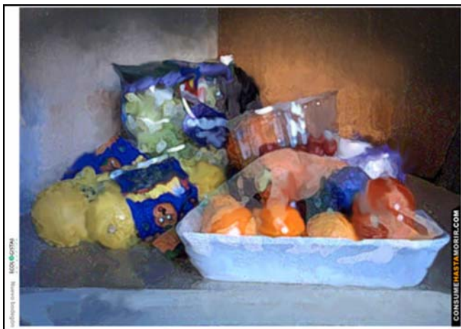
Bodegón de siglo XXI. De la colección “Clásicos del Arte” de Consume hasta Morir

A partir de este marco común, los legisladores canarios se han dedicado a “sectorizar” los residuos, creando una amalgama de órdenes y decretos dispersos y difíciles de seguir: Decreto 65/2001, de 5 de marzo, por el que se regula el contenido y funcionamiento del Registro de Productores de Lodos de Depuradoras y del Libro Personal de Registro. ( BOC nº 36 de 21 de marzo de 2001 ), Orden de 25 de agosto de 1999, por la que se establece la Declaración Anual de Envases de tipo comercial e industrial y su gestión ( B.O.C. nº 137 de 13 de Octubre de 1999 ), etc.