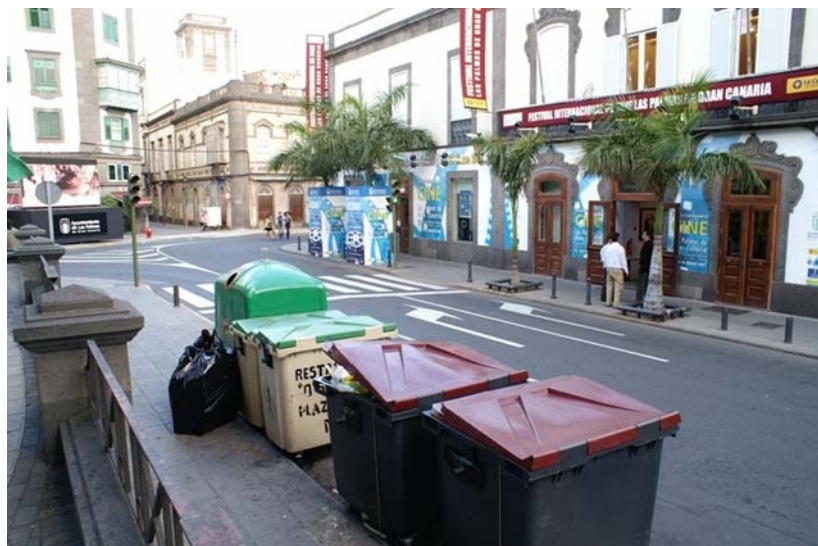
Aquí sólo se puede separar el vidrio, lo demás se mezcla

Muchos locales como supermercados y restaurantes tienen sus propios contenedores que no están destinados a la recogida selectiva, con lo cual entendemos que no separan las grandes cantidades de basura que producen.