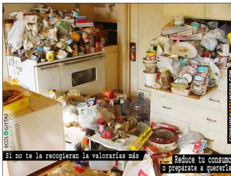
Cartel contrapublicitario de la exposición "Consume hasta morir" ( www.consumehastamorrir.com )

Debido a la escasa incidencia del sector industrial (productor) en el archipiélago, la mayor