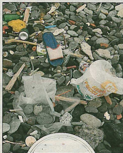
Abandono. Por la piscina de El Altillo discurren las aguas fecales de los domicilios y restaurantes. Sus alrededores, además, acumulan plásticos, latas y vidrios. Esta estampa también se ve en otras zonas de la costa Norte.