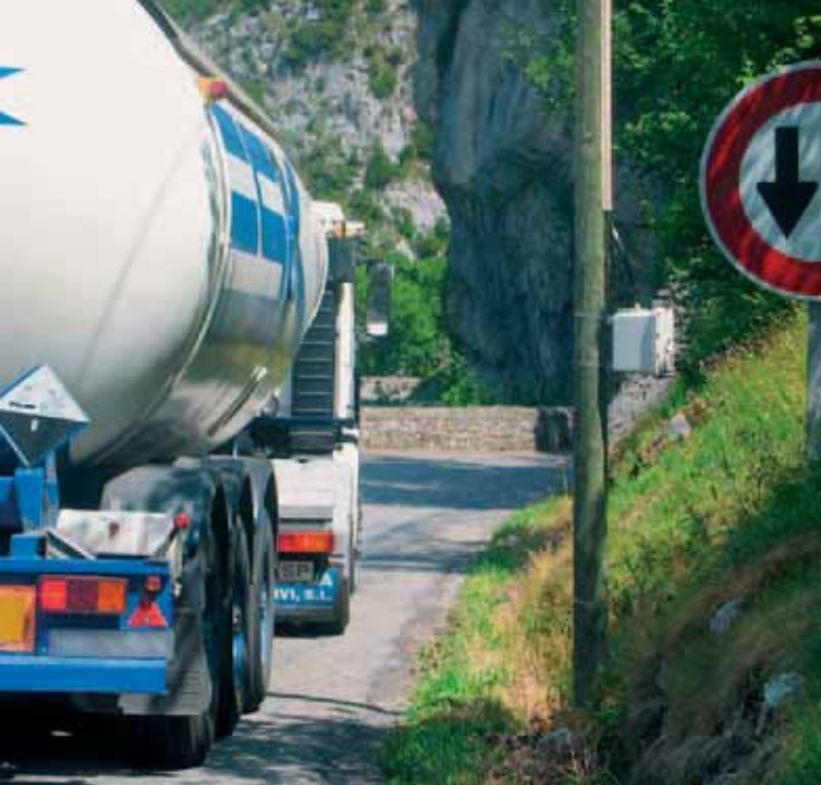
El tráfico de camiones es una amenaza para el Pirineo

3 ¿Por qué no se reabre este ferrocarril? Porque hoy, con España y Portugal en la Unión Europea, la situación económica ha cambiado. De hecho, se ven muchos camiones en la carretera española N-330 y en la francesa RN-134, paralelas a la vía férrea.