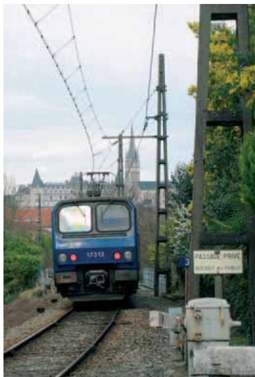
El Canfranc puede reabrirse hasta Pau en dos o tres años

Sin contar el tramo Olorón-Bedous, para el que ya hay fondos consignados, con 100 millones de euros los trenes diésel franceses podrían llegar a la estación internacional de Canfranc.