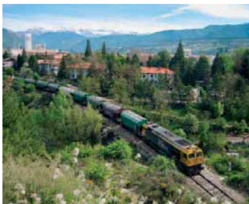
La solución sobre raíles: tren de cereales en la línea de Canfranc

Aunque la principal vocación de la línea es el tráfico de mercancías, también podría ser muy útil para los viajeros. La mejora de los servicios entre Pau y Olorón ha supuesto un crecimiento del 10% en el número de viajeros que los utilizan para sus desplazamientos cotidianos. Lo mismo podría ocurrir al sur de los Pirineos, especialmente en el cada vez más activo corredor entre Zaragoza y Huesca. Pero la mayor parte de los usuarios previsibles serían los que viajan al Pirineo por motivos turísticos, ya que la línea sirve a cuatro estaciones de esquí alpino (Astún, Candanchú, Formigal y Panticosa), una de esquí nórdico (Le Somport), y centros turísticos del atractivo de Jaca, Panticosa, el Valle de Aspe o el Circo de Lourdiós. También el tráfico internacional puede alcanzar cifras considerables, no solo por las peregrinaciones a Lourdes sino porque el Canfranc uniría en 2012 las líneas de alta velocidad Madrid-Zaragoza-Huesca y Burdeos-París.