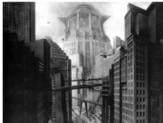
Fotogramas de Metrópolis (Fritz Lang, 1925)