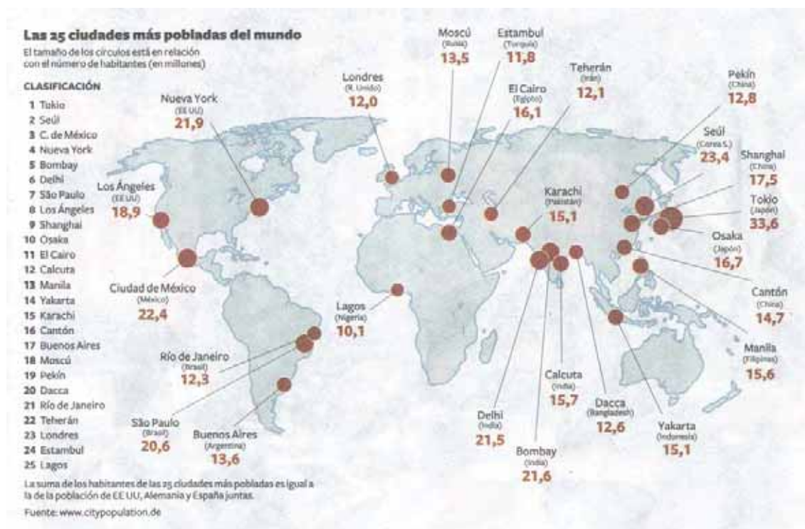
Figura 2. Las 25 ciudades más pobladas del mundo. http://www.citypopulation.de/

urbano-metropolitano desde el punto de vista demográfico tiene lugar en el Sur, y fundamentalmente en torno al Pacífico y al Índico, en el Este y Sudeste de Asia (ver figura 2) ( www.citypopulation.de ). Sin embargo, aunque las principales metrópolis centrales no ocupen ya muchas de ellas los primeros lugares del ranking en cuanto a población, si se siguen manteniendo por supuesto en cabeza (todavía) en cuanto a importancia económica y sobre todo financiera. Además, no son para nada comparables las grandes metrópolis del Centro y las Megaciudades periféricas, pues en estas últimas más de la mitad de su población en muchos casos vive hacinada en situaciones de absoluta miseria, en tejidos urbanos enormemente degradados y sin ningún tipo de servicios. Más de 1000 millones de personas, de los más de 3000 millones que habitan en áreas urbanas en el mundo, viven en esos gigantescos tejidos de infravivienda, habiendo sido expulsadas la gran mayoría de ellas hacia las Megaciudades periféricas por la “modernización” forzada del mundo rural. En algunos casos, como en Colombia, manu militari . En definitiva, este mundo crecientemente urbanizado es a su vez, cada vez más, un planeta de “Ciudades Miseria”, como nos recuerda Mike Davis (2005).