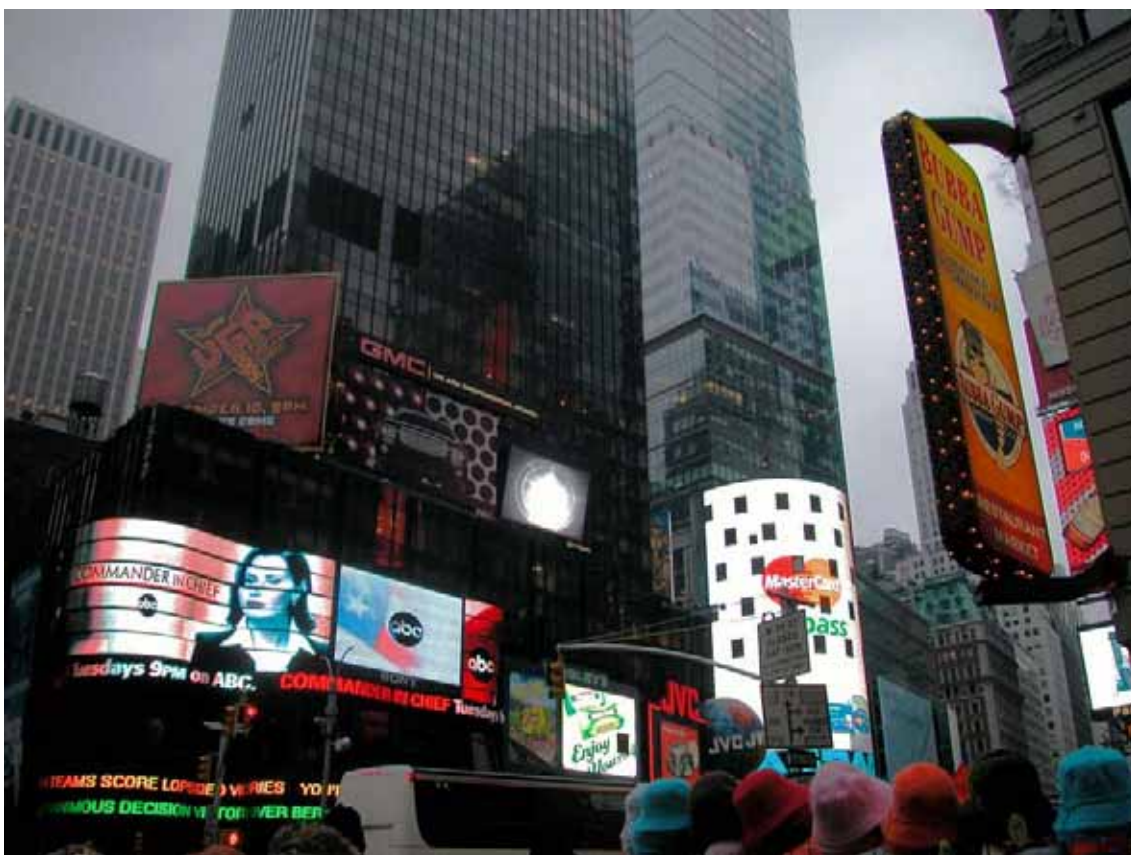
Times Square en Manhattan (Nueva York) en la esquina de Broadway y la Séptima Avenida. Chusa, 2005

interrelacionadas a través de la publicidad y el poder de la imagen. En EEUU, la Sociedad de Consumo por excelencia, el telespectador medio ve unos 30.000 anuncios al año (Mander, 2004), y la situación en otros territorios, tanto centrales como periféricos, va camino de igualar al gigante estadounidense, aunque, eso sí, con distintos ritmos e intensidades. El consumo pues que se expande es principalmente el de las grandes marcas, que han sabido imponer sus Logos a través de una fuerte inversión publicitaria (Klein, 2002). Muchos de alcance mundial. Lo cual les reporta un doble beneficio. Por un lado, amplían su mercado a costa de otras marcas de menor acceso a los medios, o directamente sin acceso a los mismos por su pequeño volumen de negocio. Y por otro, una vez adquirido el tamaño suficiente que les permite salir a Bolsa, son capaces de crear “dinero financiero” (acciones, obligaciones, etc.), y que se acepte como tal en los parqués bursátiles, ante la confianza que inspira una marca que opera en mercados cada vez más globales. Lo cual, a su vez, les posibilita impulsar estrategias de adquisiciones y fusiones para devenir en actores aún más relevantes en los mercados mundiales. Un círculo virtuoso propiciado por el impulso mediático. Ese ha sido el proceso en las últimas décadas de las principales Transnacionales mundiales.