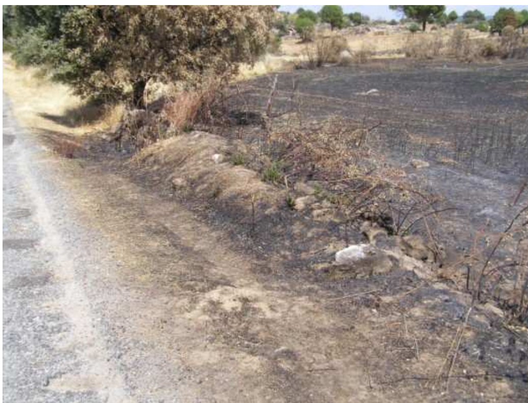
CUNETA DE LA CARRETERA DE LA C. DE MADRID DONDE SE INICIÓ EL INCENDIO DE ALMOROX, EL CUAL DIO LUGAR A NUMEROSAS EVACUACIONES.

Aparte del riesgo evidente de pérdida de vidas humanas que supone, esta situación dificulta mucho los operativos contra incendios al tener que darse prioridad a la atención de zonas habitadas. Todo ello en detrimento de medios que en otras circunstancias se dedicarían a evitar un mayor daño en la superficie forestal.