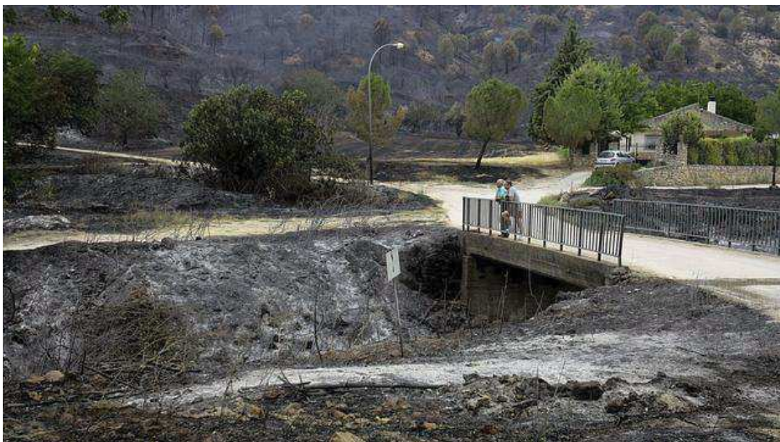
PAISAJE TRAS EL INCENDIO EN VALDECONCHA, GUADALAJARA.