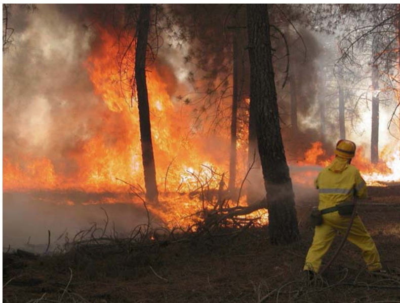
ATAQUE DIRECTO DE UN ESPECIALISTA EN SEVILLEJA DE LA JARA-TOLEDO.

Sólo hay 5 vehículos ligeros en CLM que lleven los dispositivos a que obliga la ley para participar en extinción de incendios forestales, uno por provincia. Ello da lugar a los consiguientes retrasos y riesgos a la hora de acudir a un incendio. Por otro lado, también se han suprimido varias máquinas pesadas (buldózer) y reducido el horario de las restantes esta campaña, siendo esta maquinaria imprescindible para los grandes incendios principalmente (>500 Has), siendo su misión esencial la de perimetrar y acotar mediante la realización de fajas cortafuegos.