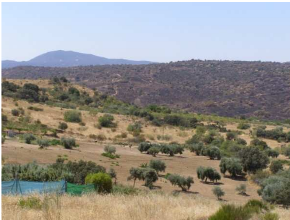
LADERA AFECTADA POR EL INCENDIO DE ALMOROX- TOLEDO