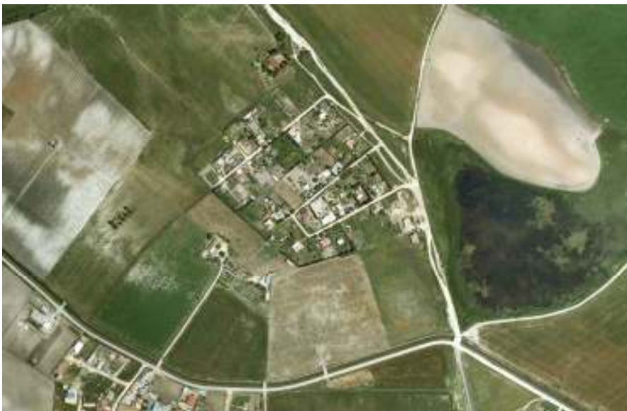
Anexo 4. Área para la Reserva de Espacios Libres de la Sierra de San Cristóbal (POT de la Bahía de Cádiz)