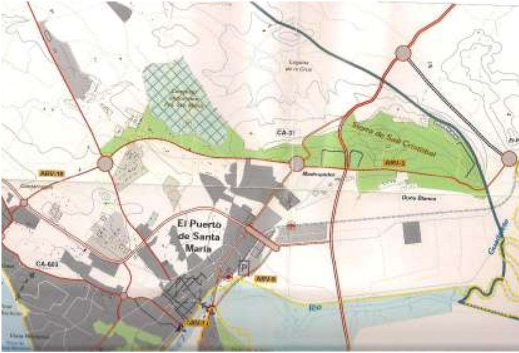
Anexo 5. Zonas naturales a proteger en el PGOU y su interconexión por corredores ecológicos