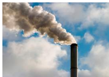
Ilustración 9: Humo