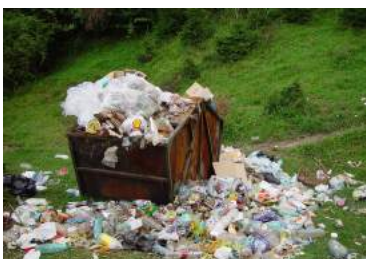
Ilustración 10: Plástico