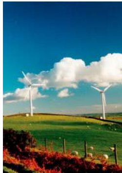
Ilustración 2: Energías renovables