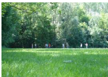
Ilustración 10: Gente jugando en el campo