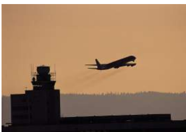
Ilustración 7: Avión