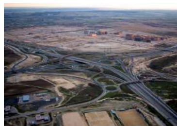
Ilustración 3: Nudo de carreteras