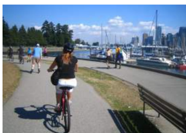
Ilustración 7: Bicicletas