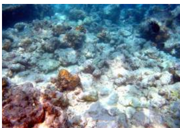
Ilustración 5: Corales blanqueados/degradados