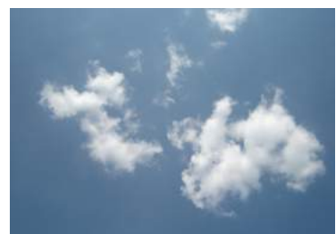
Ilustración 9: Cielo limpio