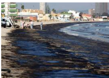
Ilustración 8: Vertido de petróleo