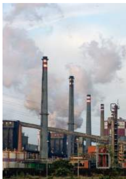
Ilustración 2: Central térmica