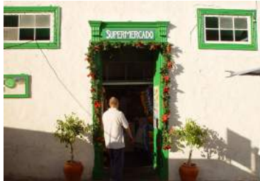
Ilustración 1: Mercado