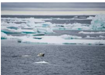
Ilustración 4: Deshielo y oso polar