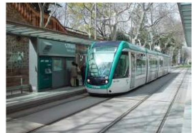
Ilustración 6: Transporte público