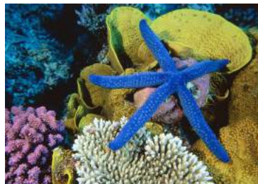
Ilustración 5: Corales vivos