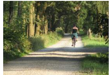
Ilustración 3: Carretera rural con bici