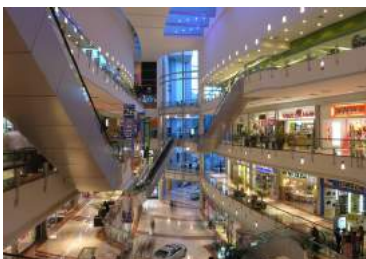
Ilustración 1: Centro comercial