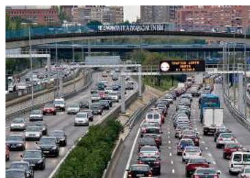
Ilustración 6: Atasco