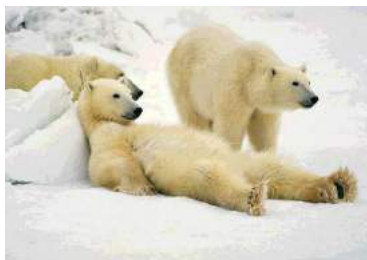
Ilustración 4: Osos polares