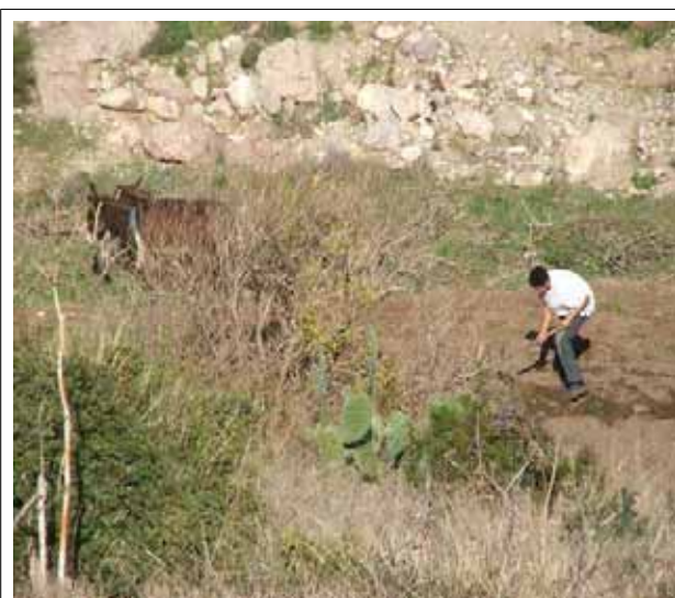
Campesino trabajando con burro

Hemos visto que se comienza a abandonar la agricultura como uno de los principales medios de vida. Una de las razones es que el precio de los productos agrícolas son muy bajos (sufriendo la competencia de los productos subvencionados de Europa) y no dan para vivir, así nos lo dijo un campesino. Otro dijo, que “los jóvenes ya no tienen el carácter de trabajar duro y el trabajo en el campo es duro. Los jóvenes ven más posibilidades en irse a España.”