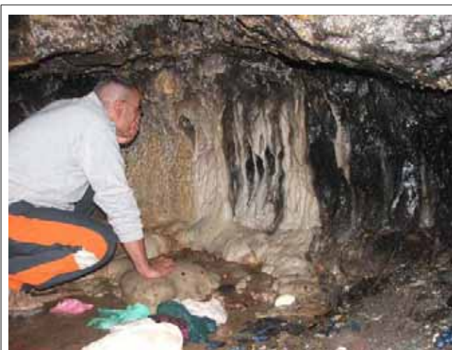
Morabo Cueva de los Trapos

Las antiguas tumbas eran simplemente una piedra sobre el lugar en el que se enterraba a alguien, desapareciendo todo vestigio del enterramiento al poco tiempo entre la maleza.