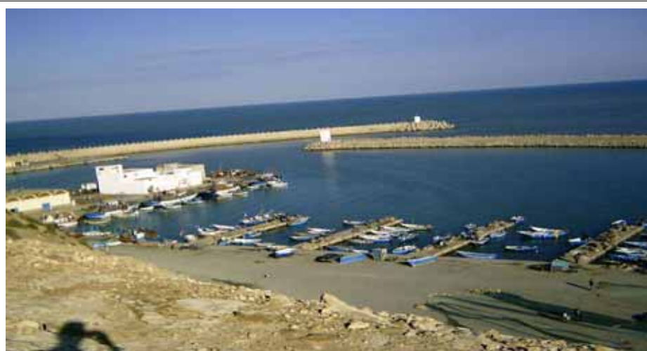
Puerto de Cabo de Agua

Queríamos saber si la desaparición de la foca monje les importaba, y que valor tenía la foca para la gente. Un hombre nos contestó, que la foca antes había sido vista como un hermano del hombre. Que no veían ningún peligro en ella, sabían bien que la foca monje no competía por los peces y no rompía las redes de los pescadores.