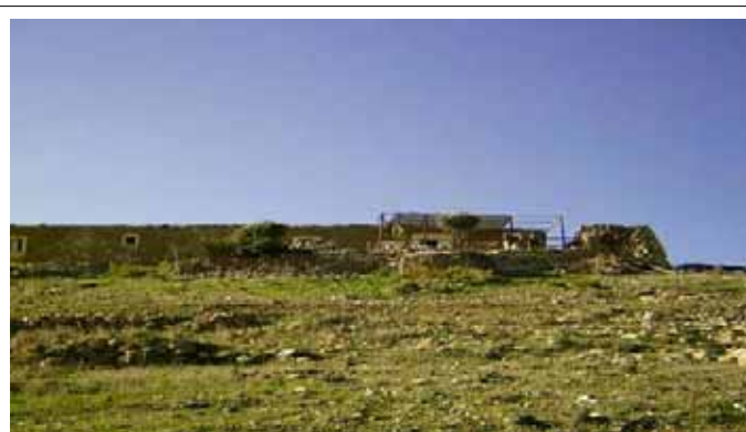
La casa en Tibouda, donde vivimos

Desde el "Centro de observación y estudio del Medio Ambiente del Cabo Tres Forcas", en el norte de Marruecos llevamos a cabo un curso de antropología ecológica durante una semana. Un pequeño grupo de interesados, de Marruecos (del Rif), España y Alemania empezamos a investigar la relación de la población Amazigh (bereber) del Rif marroquí con su medio ambiente (específicamente en Cabo Tres Forcas).