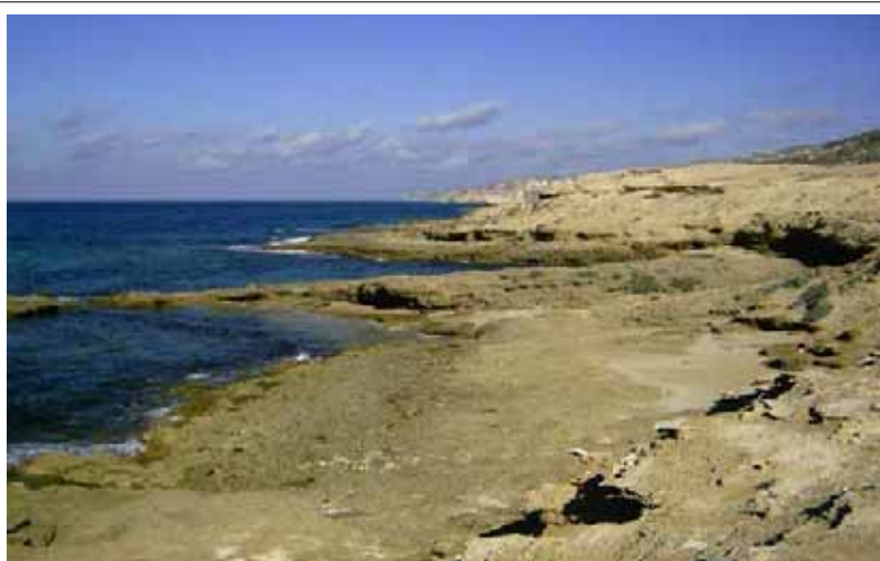
Costa de Taxdir

La agricultura juega cada día un papel menos importante en el Cabo Tres Forcas y eso no es porque las tierras han cambiado, sino por razones del mercado mundial y cambios en la cultura (nuevas necesidades, necesitan más dinero, migración...). Como consecuencia trae más erosión y eso nuevos problemas.