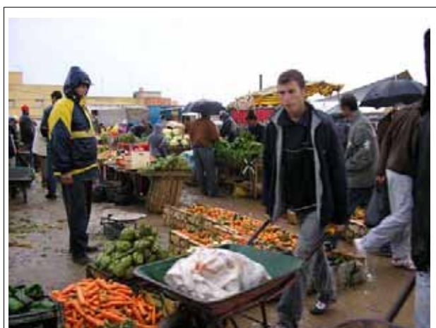
Mercado en Beni Chiker

Según el lema "haciendo se aprende" fuimos a varios lugares diferentes, donde entrevistamos a la gente para conocer la vida y la cultura de esta zona. Empezamos un domingo lluvioso y embarrado en un mercado local, hablamos con pescadores y agricultores, visitamos Morabos (lugares sagrados), hablamos con gente mayor y con jóvenes, las mujeres del grupo conocimos la hospitalidad de las mujeres rifeñas cuando visitamos sus casas. Fuimos a largas caminatas, conociendo el precioso paisaje, una costa diversa y fascinante. Vimos flamencos y monos, encontramos hongos y huesos de mamíferos marinos.