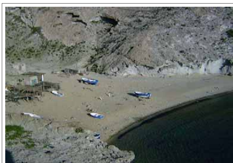
Calita con barcos de los pescadores artesanales

Junto con la agricultura, la pesca era tradicionalmente la otra fuente de alimento y de ingreso. La pesca artesanal con pequeños barcos casi ha desaparecido. Quedan pocos peces cerca de la costa, así que muchas veces este verano han regresado de vacío. Al mismo tiempo el precio del gasoil subía mucho. Muchos ya no salen a pescar.