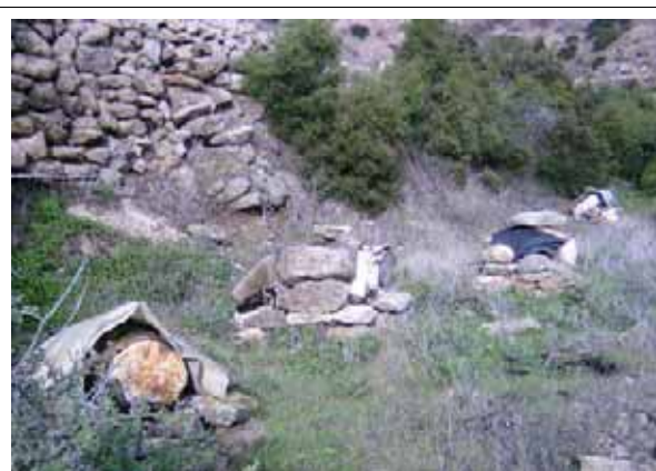
Colmenas cerca de la huerta

Antes de realizar la idea falta por supuesto un análisis más profundo, por ejemplo, hasta que punto la flora de la región permite un aumento de la apicultura.