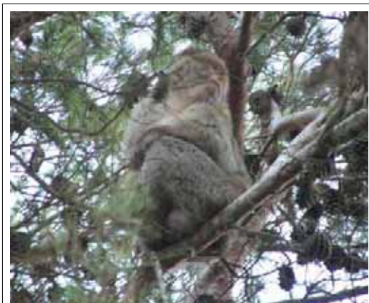
Mono en el Gurugú

La gente local no parece ser hostil en contra de los que llaman “negros”. Pero sí advierten que de vez en cuando roban (lo cual no es extraño considerando las circunstancias). Y también se han mencionado los efectos negativos que causan el gran numero de emigrantes en los bosques. En el bosque del monte Gurugú por ejemplo viven monos, que alguna vez probablemente han servido como alimento de los subsaharianos.