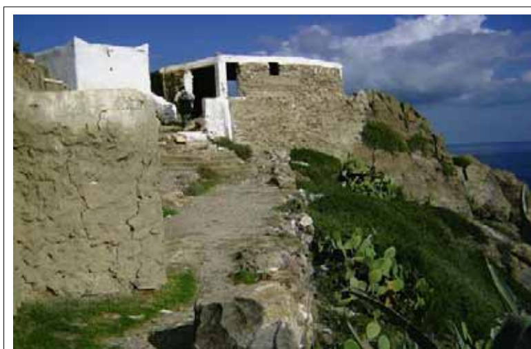
Morabo de Oarch

Suelen estar en un sitio especial, ya sea una gran roca, un gran árbol, la cima de una colina desde la que se divise un bonito paisaje, etc. Allí entierran a un hombre santo ( morabo, marabut, morabit) a petición propia, y está prohibido cultivar , talar o pastorear en dicho sitio, convirtiéndose con el tiempo en pequeñas selvas que hacen las veces de reserva botánica y de observatorio de la antigua vegetación que dominaba la zona.