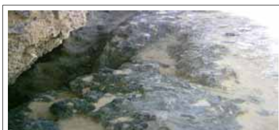
Entrada a la cueva