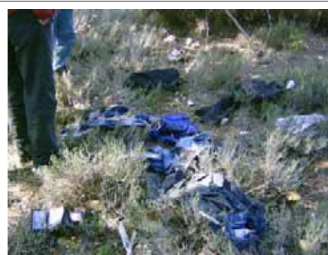
Ropa en el Bosque de Taurik

A parte de la migración de los Marroquíes, hay que mencionar los cientos (o más bien miles) de emigrantes que vienen más del sur y intentan cruzar la frontera hacia Melilla, hacia España. Hemos visitado el bosque de Taurik desde donde cientos de ellos intentaron saltar la valla hace medio año. Solamente encontramos un campo militar, vigilando la región y alguna ropa tirada.