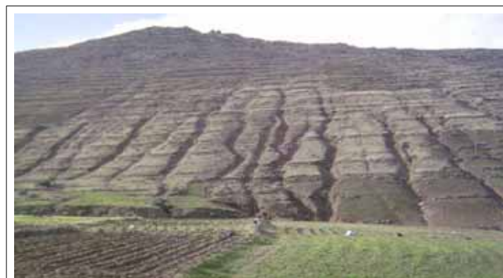
Falta de terrazas = Erosión

Un trabajo importante (que falta por hacer) desde el punto de vista de la conservación, sería investigar si todavía se