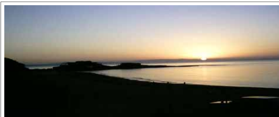
Playa de Charana

Pero también en otra parte del medio ambiente (que no es “ecológica”, sino más bien “política”), la frontera cercana entre Europa y África, va a tener (tal vez) el impacto más grande en el desarrollo de la región.