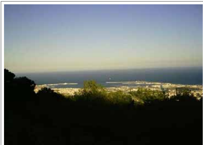
Puerto de Melilla y Puerto de Beni Ansar/ Nador