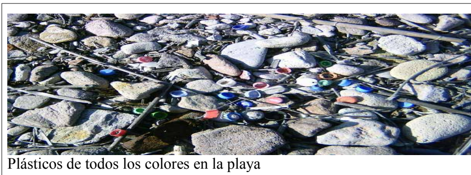
Plásticos de todos los colores en la playa

Un cambio ciertamente se ve en las playas, algunas cubiertas de plásticos de todo tipo. Otra basura, no tan visible – pero mucho más toxica, son las pilas.