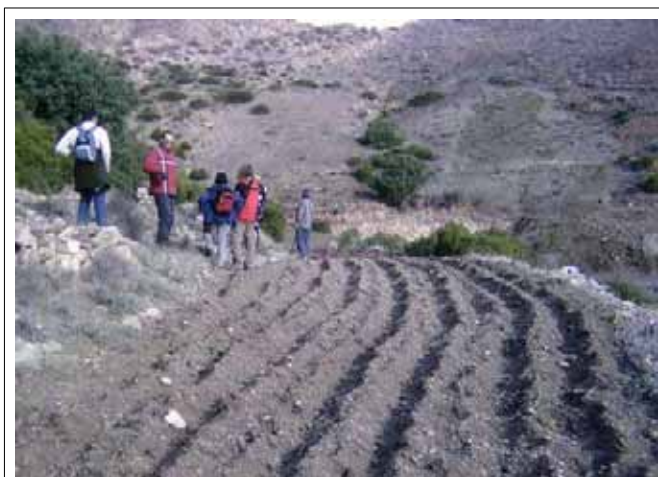
Visita de una terraza

Por el terreno montañoso la agricultura es de pequeñas parcelas en terrazas. Los cultivos que se trabajan mayormente en secano son: patatas, cebollas, habas, tomates, guisantes, legumbres y cereales. Un campesino nos contó, que sus patatas que vienen de Holanda daban 2 años una buena cosecha, luego compraba otra vez semillas. Desde unos 5 años empezó a usar agroquímicos, existe una enfermedad de la planta de papa que hace pequeños puntos rojos en las hojas. La otra amenaza es un gusano que se come las hojas. También nos dijo que antes no había tan a menudo estas enfermedades.